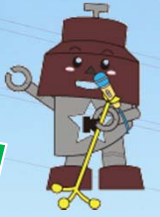
川口市マスコット「きゅぼらん」