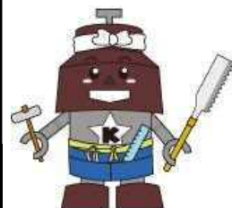
川口市マスコット きゅぼらん