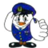
埼玉県警察マスコット 「ポッポくん」