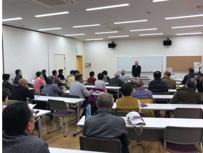
11月9日（土）～11月30日（土）実施 川口市民大学 平安・鎌倉時代の仏教史入門