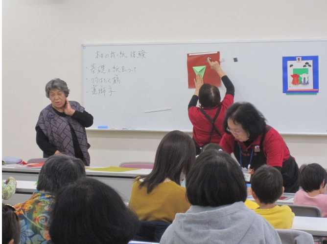
4月27日（土）実施 みんなで楽しくおりがみ教室