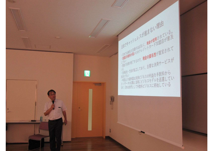
9月7日（土）実施 消費生活講座 キャッシュレス社会に向けて