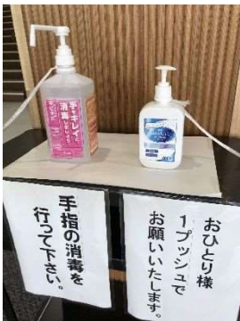
(アルコール消毒液の設置)