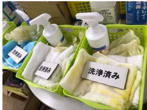
(利用時の消毒セットの貸出し)