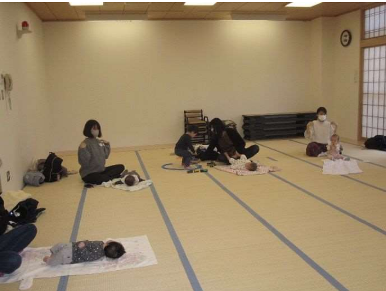
セミナー受講風景