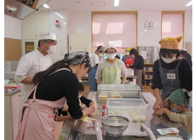
親子パン作り教室作業風景