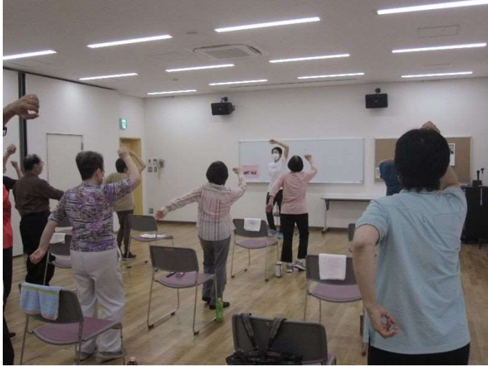
川口市民大学 ベクトルウォーキング & ストレッチ講座受講風景