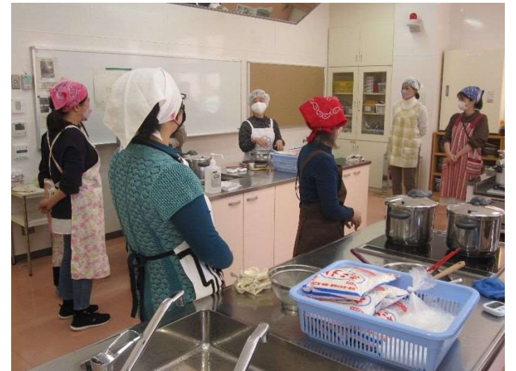
手作り味噌教室受講風景