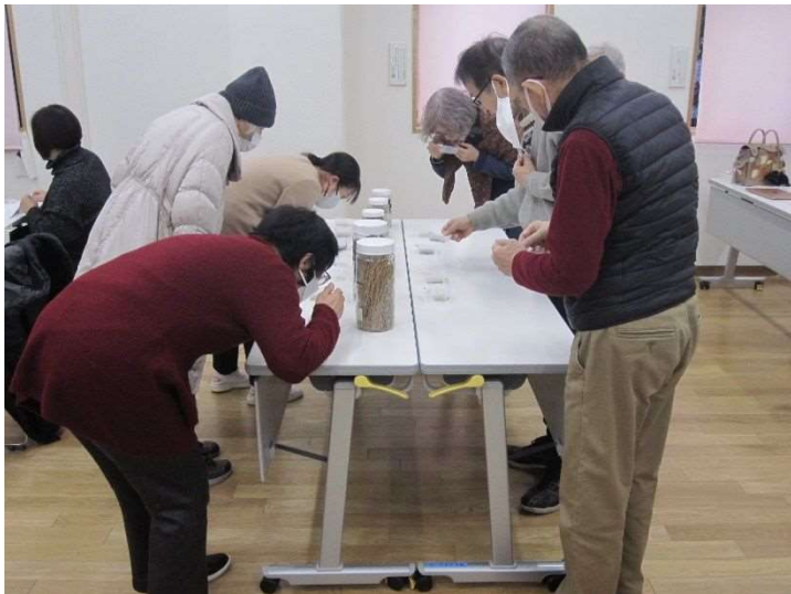
漢方薬学入門講座受講風景