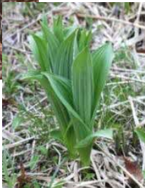
芽出し期のコバイケイソウ