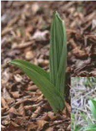
芽出し期のバイケイソウ