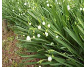
スノーフレーク (スズランスイセン)