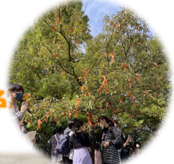
オレンジリボン運動 (株式会社コマーム)