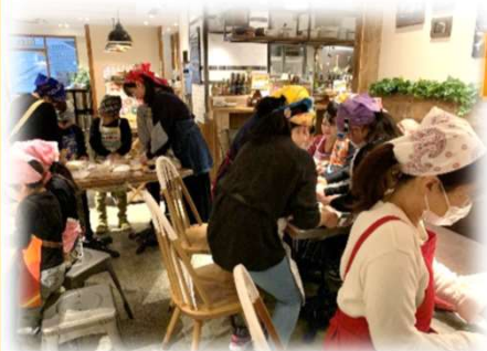
味噌作り教室 (新井商店株式会社)