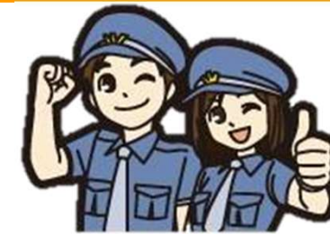
防犯についての展示、 防犯グッズ販売 (株式会社フェニックス)