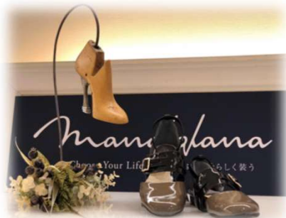
障がいの有無に関係なく お洒落できる靴の展示販売 (株式会社LUYL)