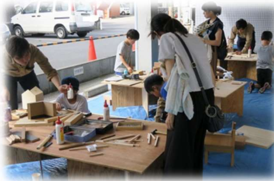
端材を使った工作教室 (埼玉興産株式会社)