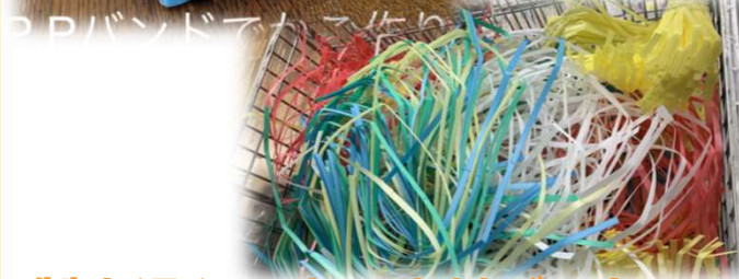
製本過程で出る廃材バンドで かご作り (中島製本株式会社)