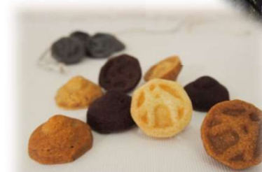
ベーゴマクッキー販売 &ベーゴマ体験 (NPO法人ヒールアップハウス)