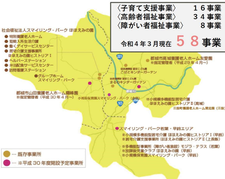
都城市内全域ほほえみマップ

日本の経済は、日本のすべての働く人に、 本気の活力を生み出すために、 「正しいことを、正しく行っている企業」 を表彰しよう。