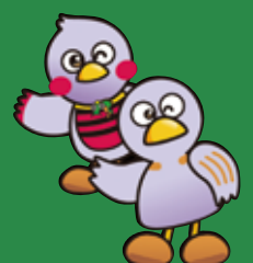
埼玉県マスコット 「さいたまっち&コバトン」