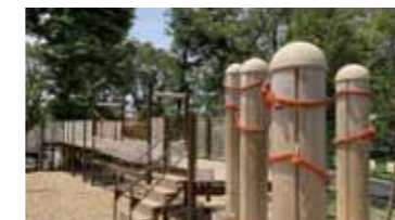
冒険の森(フィールドアスレチック)

開園時間 9:00から17:00 (入園は16:00まで) 休園日 火曜(祝日の場合開園)、 祝日の翌平日、年末年始 ※1月3日は新年特別開園(無料) 入園料 一般310円、4歳~高校生100円、年間パス券(購入日から1年間、何回でも入園OK) 1,070円 ・フィールドアスレチック 一般300円、小学生~高校生100円 ・ミニ鉄道1回220円、回数券(3枚つづり)530円 駐車場 計630台(無料)