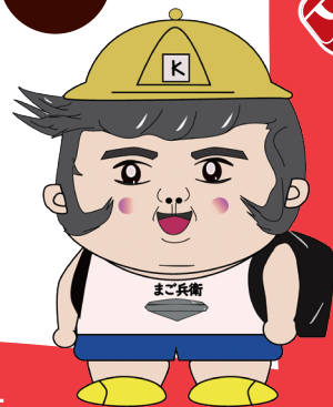
川口市経済部産業振興課 公式キャラ「まご兵衛」