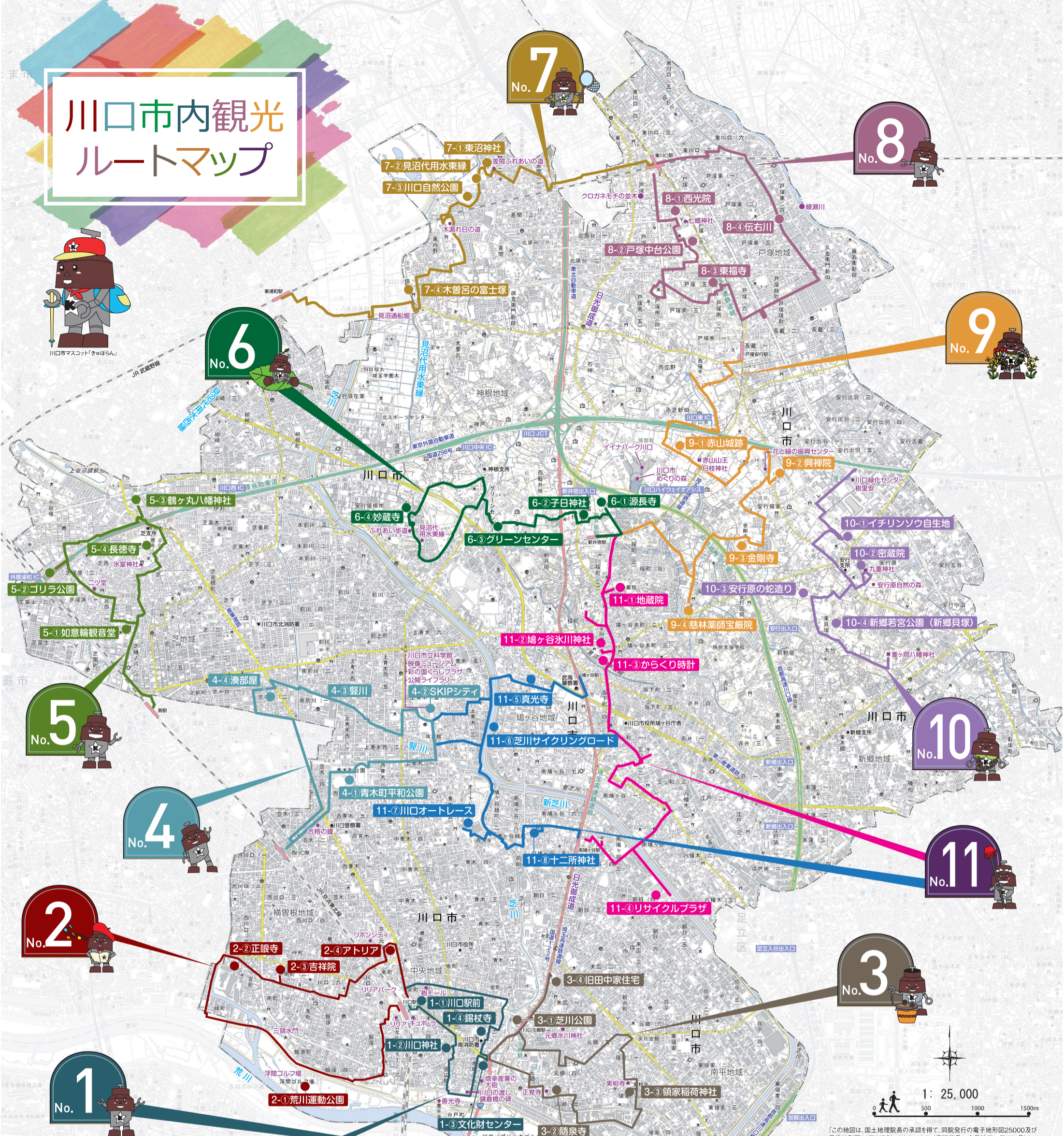
川口駅東口コース 全長4.2km 所要52分