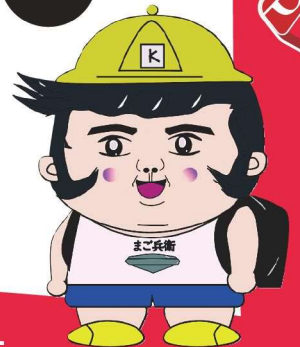
川口市経済部産業振興課 公式キャラ「まご兵衛」