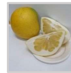
晩白柚 高山 甫 氏