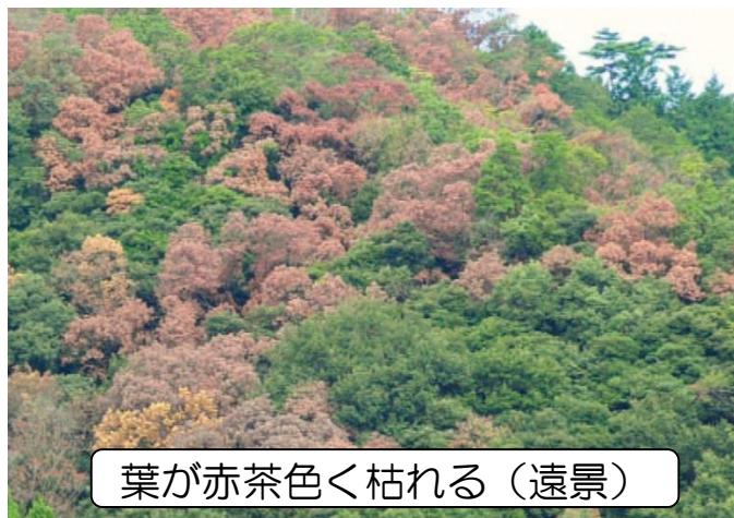
葉が赤茶色く枯れる（遠景）

次の写真のようなナラ枯れが疑われる木を発見した場合は、市町村役場もしくは下記の県の機関までご連絡ください。