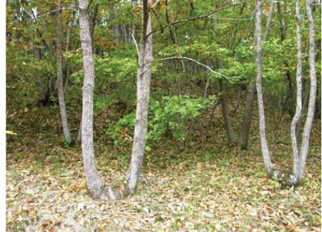
管理されているコナラ林

放置されたナラ林は、高齢化・大径木化し、カシノナガキクイムシにとって繁殖しやすい状況となり、被害が拡大しているといわれています。