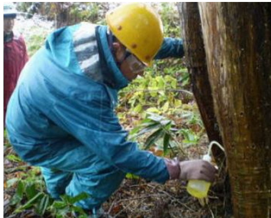
立木薬剤注入処理