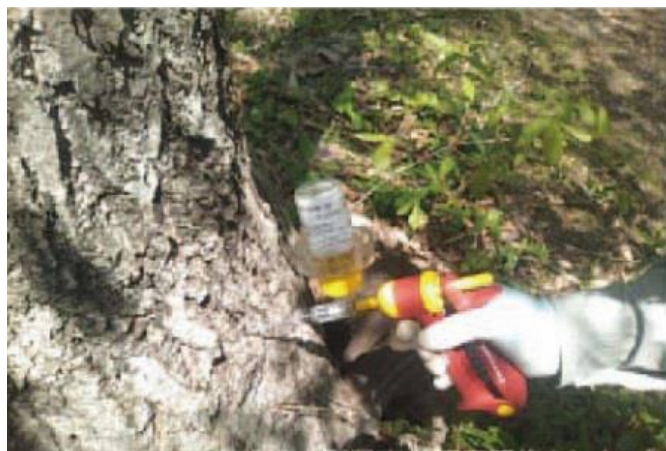
殺菌剤樹幹注入