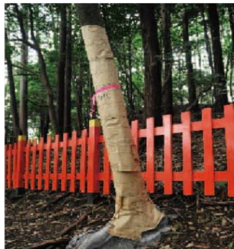
粘着シート被覆

樹幹に被覆材（粘着剤、ビニール等）を塗布又は巻き付けることによりカシノナガキクイムシの穿入及び脱出を防ぎます。