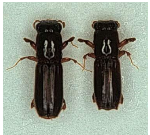
カシノナガキクイムシ メス成虫とオス成虫

カシノナガキクイムシが木に穿入し、体に付着したナラ菌（カビの一種）を感染させ、繁殖することで、水を吸い上げる機能を阻害するためです。