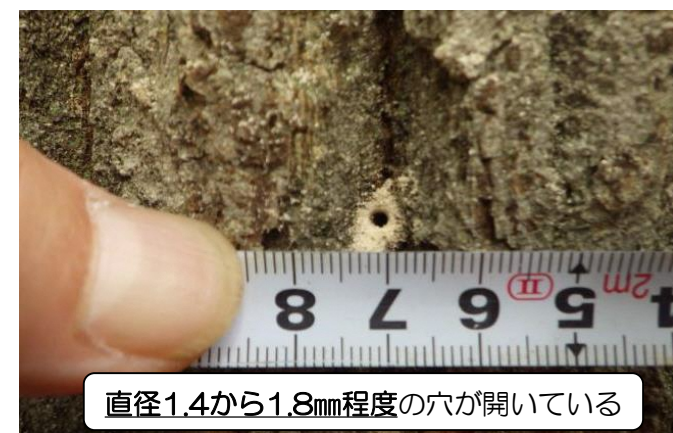
直径1.4から1.8mm程度の穴が開いている