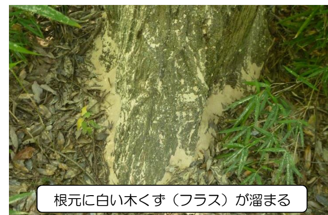
根元に白い木くず（フラス）が溜まる