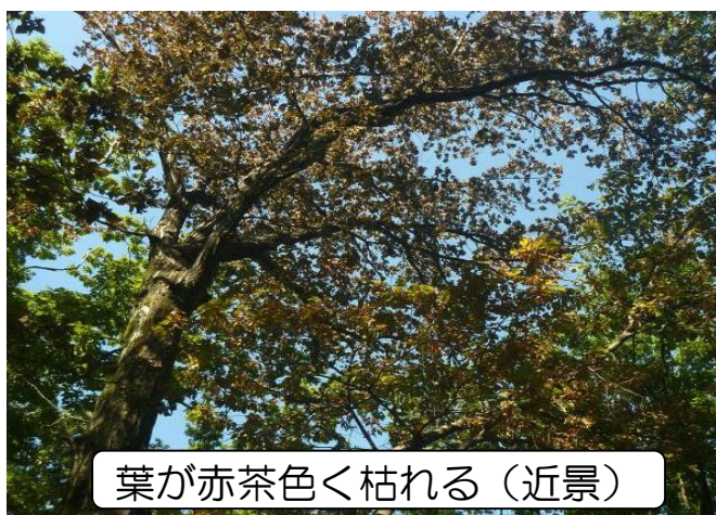
葉が赤茶色く枯れる（近景）