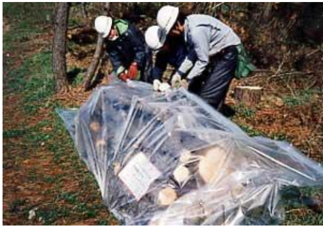
伐倒・くん蒸処理