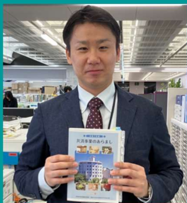
2021年度採用 事務職 総務部職員課