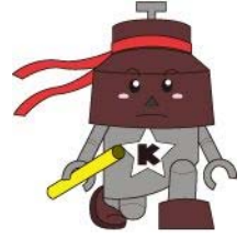
川口市マスコット「きゅぼらん」