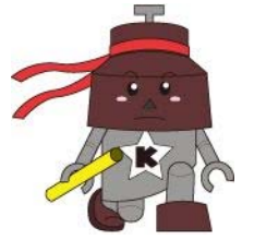
川口市マスコット「きゅぼん」