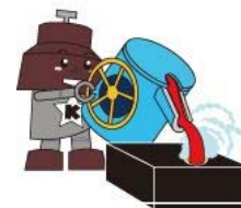
川口市マスコット「きゅぼらん」