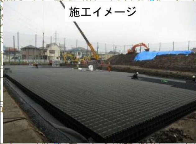
川口市北園町付近