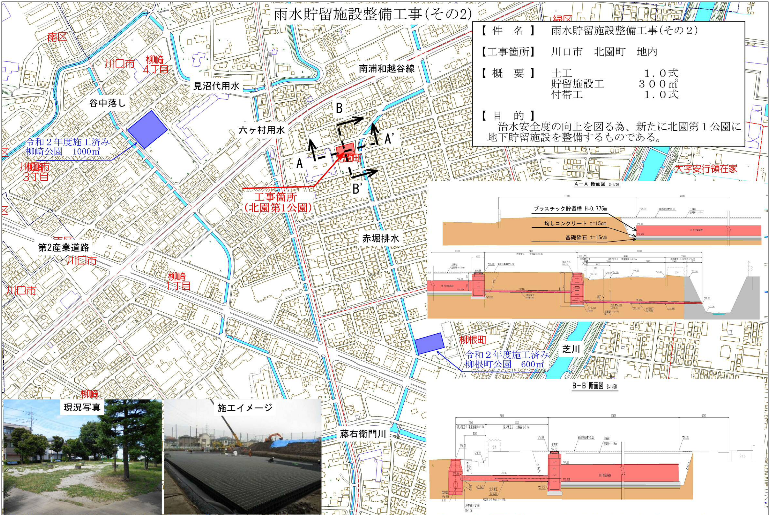
A-A' 断面図 S=1/50

【目的】 治水安全度の向上を図る為、新たに北園第1公園に地下貯留施設を整備するものである。