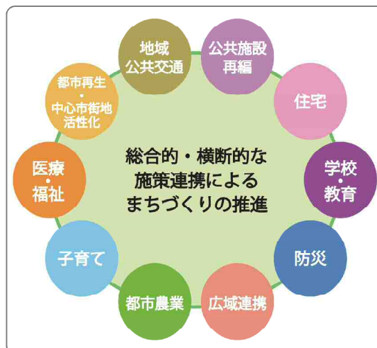
<総合的・横断的な都市づくりの体系イメージ>

都市づくりの分野においても、多岐にわたる施策との総合的・横断的な推進が求められ、防災や医療・福祉、子育て、学校・教育など様々な生活関連施策との連携を図ることが必要不可欠となっています。