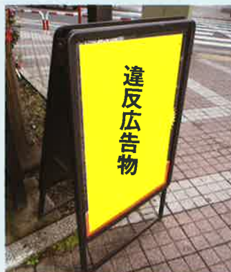
看板を勝手に路上に設置！