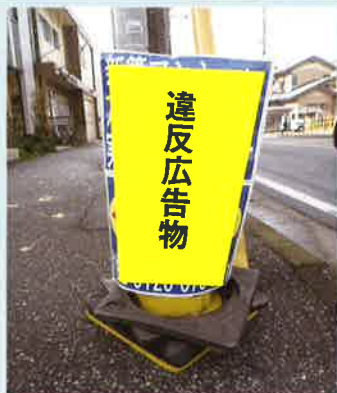
カラーコーンを使い勝手に 路上に設置！