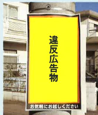
広告を勝手に電柱に設置！