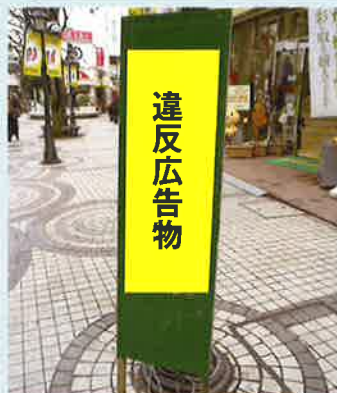
電柱等に勝手に設置！