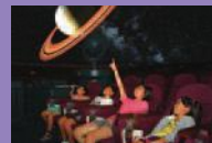
川口市立科学館(有料) ☎ 048-262-8431