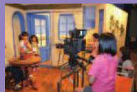
映像ミュージアム(有料) ☎ 048-265-2500