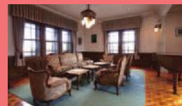
回遊式庭園も素晴らしい

大正時代に建設された3階建ての本格的洋風建築ですが、後に和館や茶室も増築され、和洋折衷の住宅になっています。本格的な池泉回遊式日本庭園も必見です(有料)。