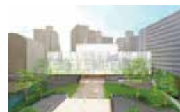
美術館（整備イメージ）