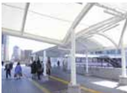
動線に屋根を設置（整備イメージ）