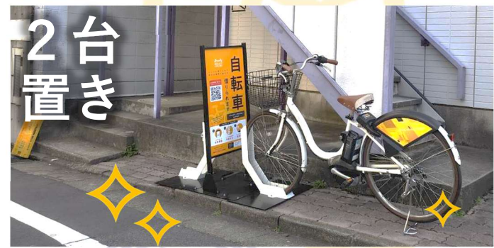
2台置き：60×420cm (看板を含む)