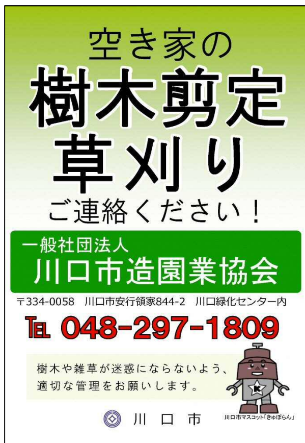
図 樹木等の管理代行に関するリーフレット

空家等は所有者等が適切に維持管理すべきものであり、建物や樹木等の管理の責任も所有者等にあります。しかし、遠方に居住している、高齢であるといった理由により、空家等を管理する意思があっても管理が困難な場合があります。そのため、こうした所有者等から相談があった際に、管理代行業者について紹介をします。