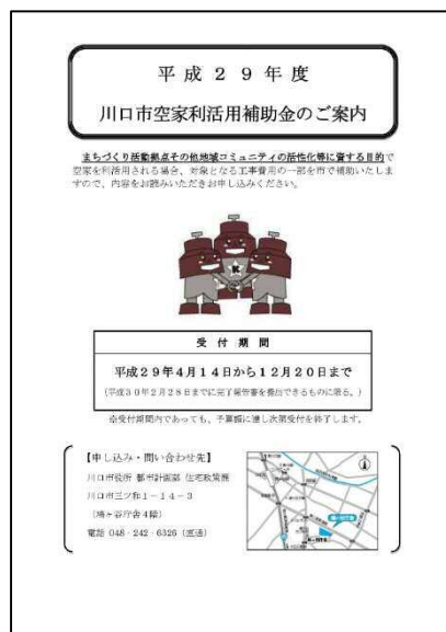
図 「平成29年度 川口市空家利活用補助金のご案内」のパンフレット

そのため市では、市民の生活・文化等を豊かにする目的を持って活動するNPO団体等に対して、まちづくり活動拠点や地域コミュニティの活性化等に資する目的での空家等の利活用を支援するため、「川口市空家利活用補助金」を設置し、NPO団体等が行う空家等の利活用のための工事費用の一部の補助を行っています。