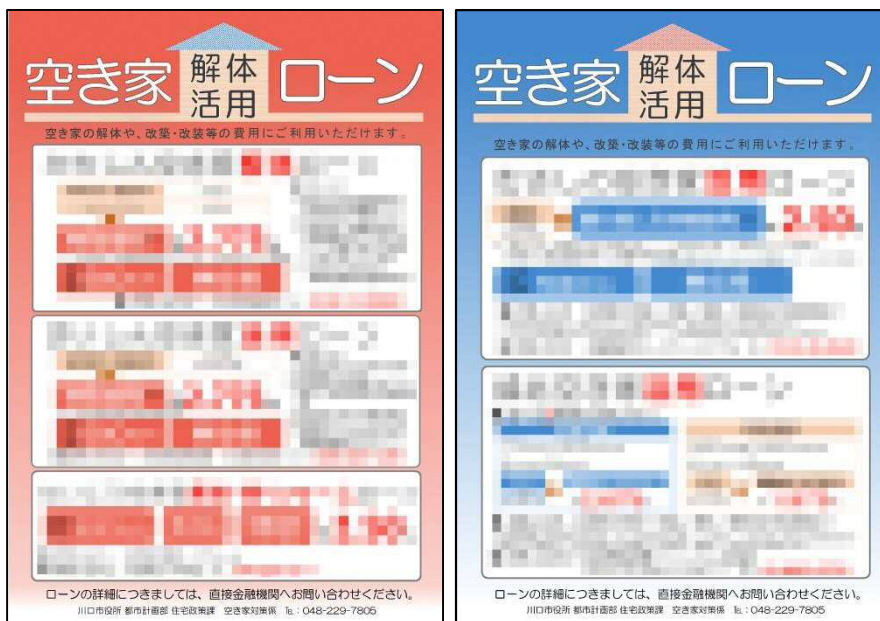
図 空家等の解体・活用の融資に関するリーフレット

倒壊等の危険性のある空家等であっても、それらは個人の財産であり、所有者等が責任を持って対応しなければなりません。しかし、所有者等が置かれた状況は様々であり、空家等を除却するにあたって、一括して除却費用等を支払うことが困難な所有者等もいます。一方、空家等の除却費用等について融資を実施している金融機関があり、その融資を用いることで、負担を分散させることができます。市では、金融機関と連携し、市の窓口においてリーフレットの配布を行う等、空家等所有者等に空家等除却費用等に関する情報提供を行います。