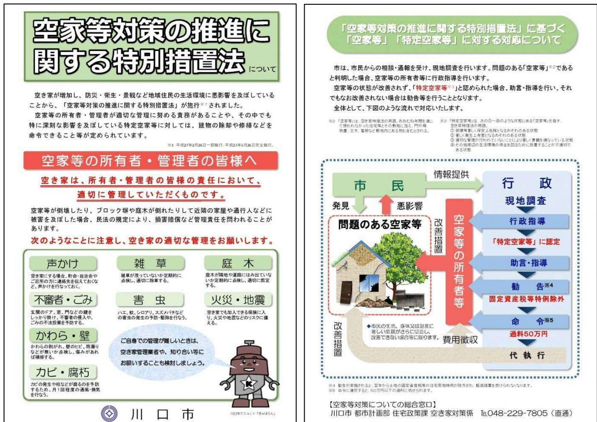
図 法に関する啓発リーフレット

また、本市では、単身高齢者世帯に子がいない割合が高い傾向にあることから、このような子がいない世帯を含む高齢者世帯の空家等に対する問題意識の醸成を図り、自宅の将来的な見通しを定め、空家等とならない予防行動を促すことが、近い将来の空家等発生に大きく影響するものと考えられます。そのため市は、高齢者やその親族と接する機会が多く様々な相談を受けることがある団体等と連携するなど、幅広く啓発を行う手段について検討を行います。