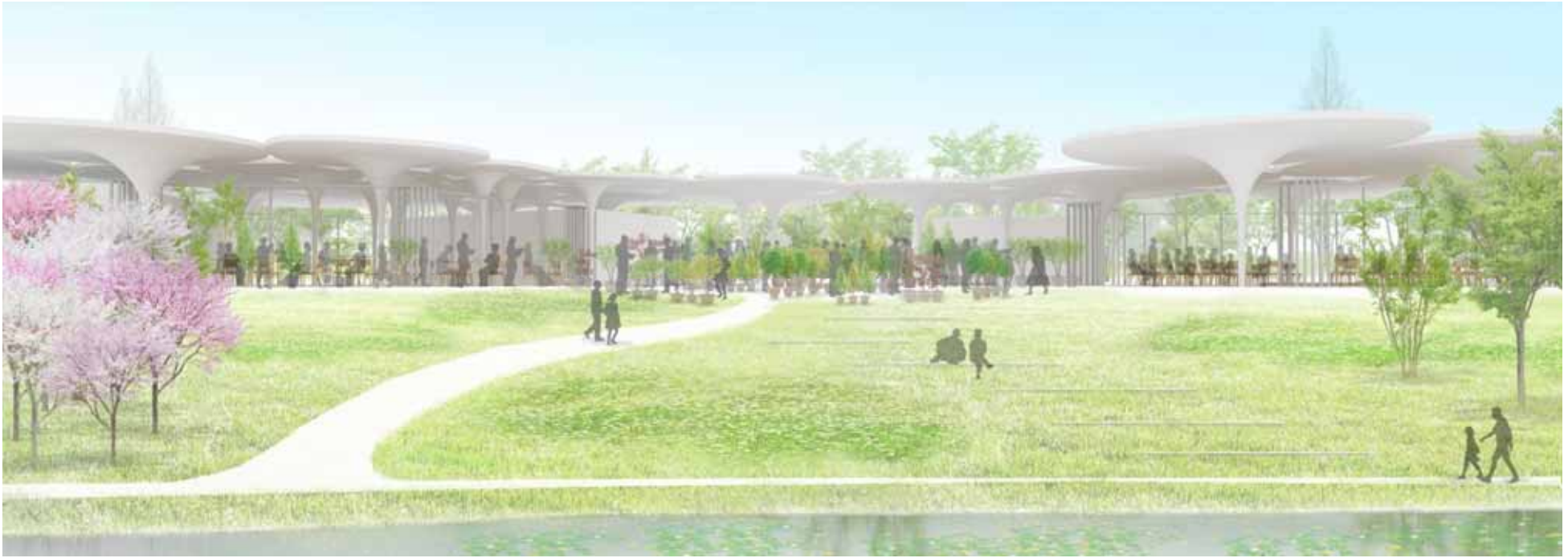
図7 (仮称)地域物産館イメージ