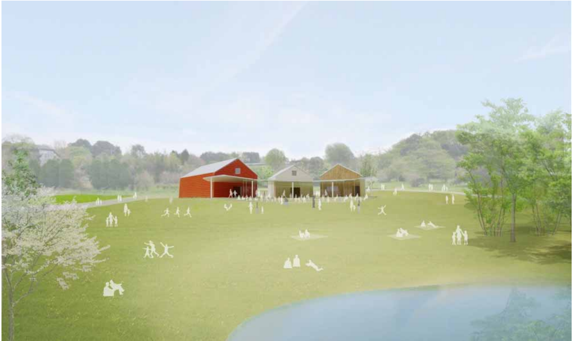
図6 (仮称)歴史自然資料館イメージ