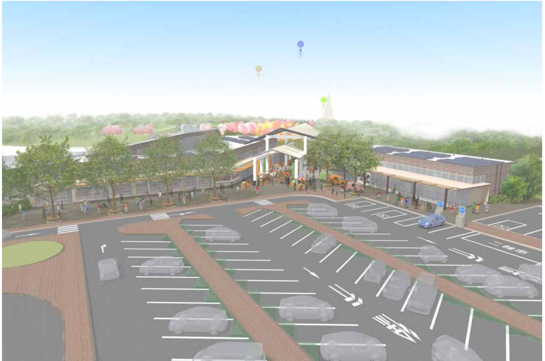
図5 赤山オアシスゾーンイメージ