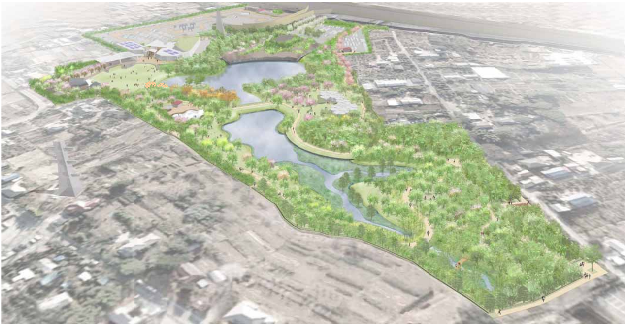
図2 全体鳥瞰イメージ