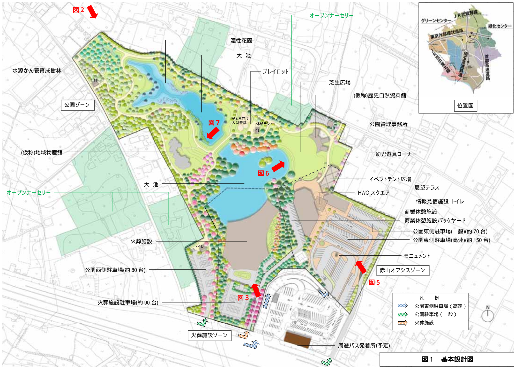
図 1 基本設計図