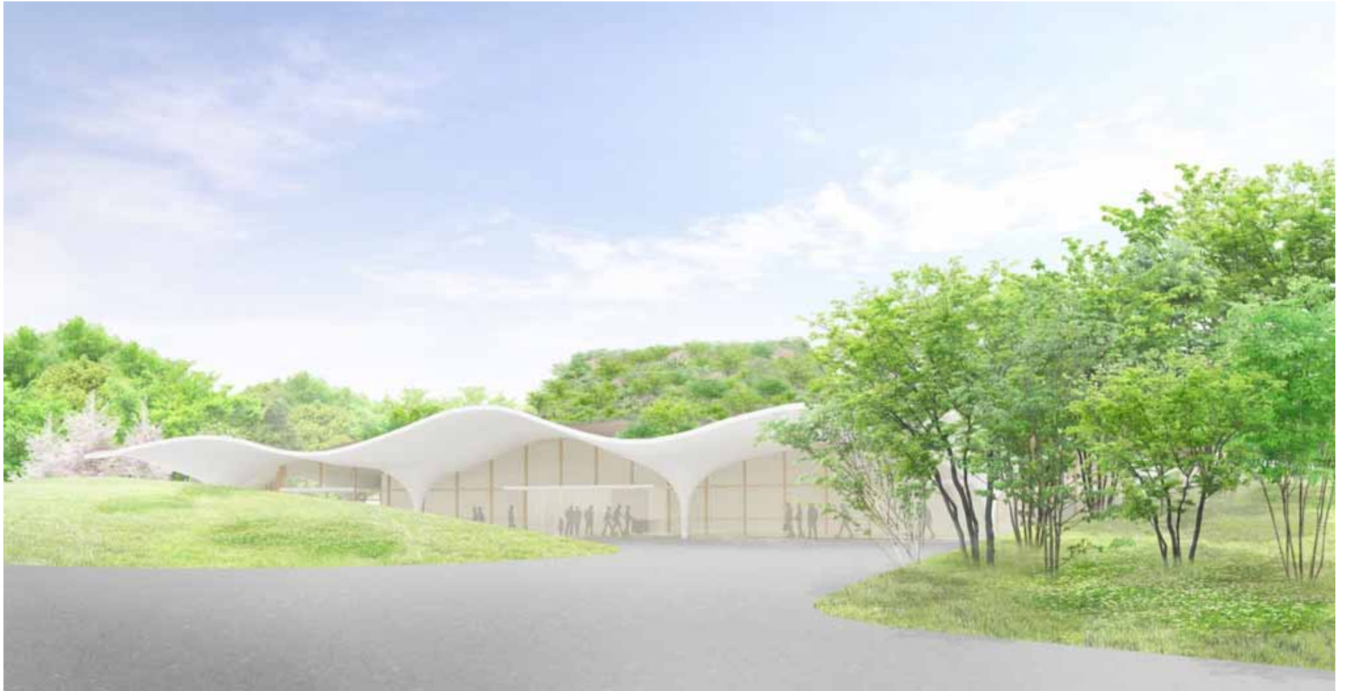
図3 (仮称)川口市火葬施設イメージ