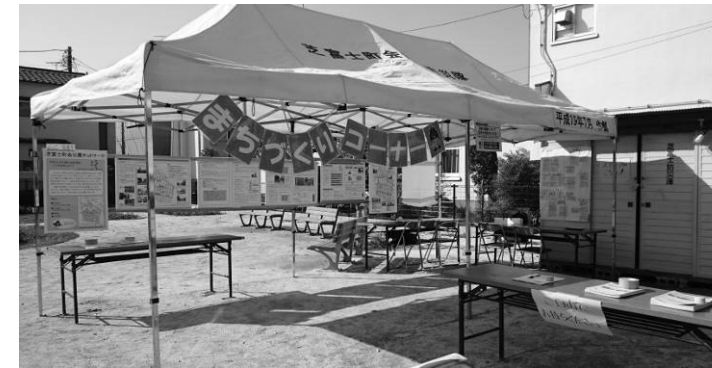
▲道路部会の提案内容とアンケート結果をパネル展示し、ご意見を伺いました。