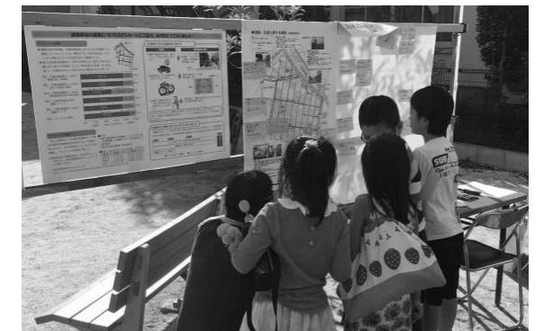
▲子どもたちも、たくさん意見を出してくれました！