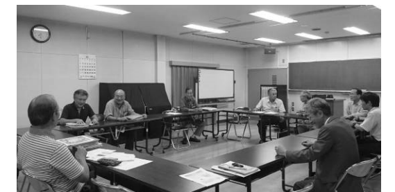
▲各部会の検討内容について協議している様子（第27回協議会）。

第28回協議会（平成29年2月14日（火））では、今年度の検討のとりまとめ、来年度の活動内容について、協議しました。