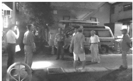
▲まちの課題について、夜の状況を確認して歩きました。

そこで課題箇所を再確認するため、8・9月に“夜のまち歩き”を行いました。現在は、「芝陸橋いちょう通り」「線路沿いの道」「水路」について検討を進めています。