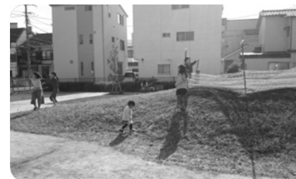
▶芝富士ふれあい公園のお山。