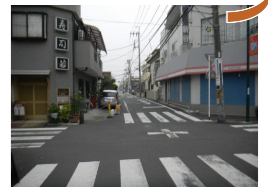
▲主要区画道路7号（整備前）