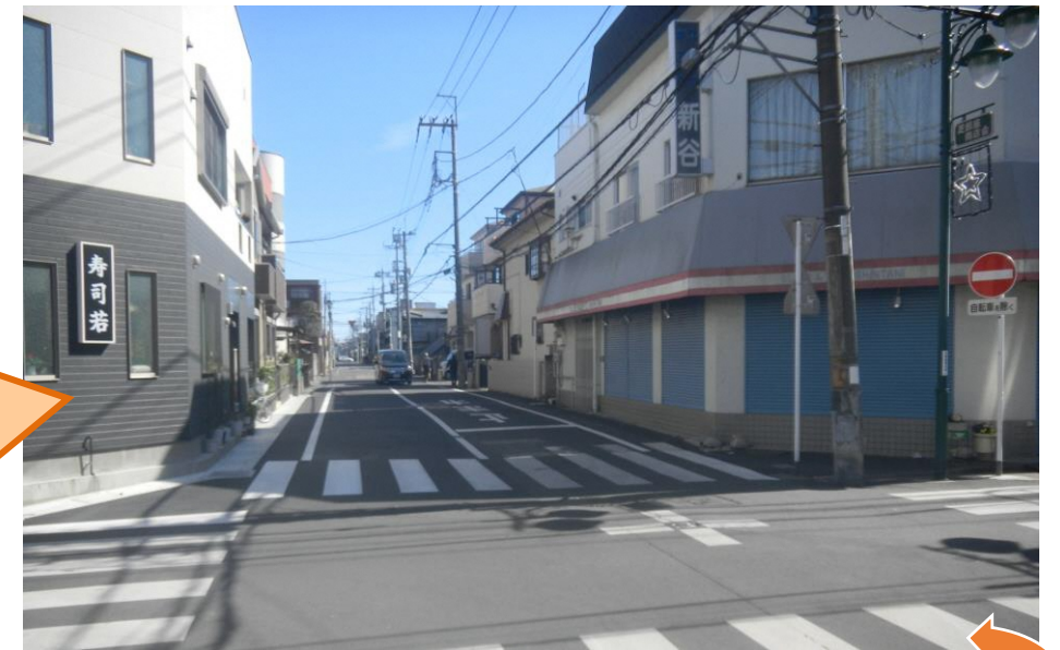
▲主要区画道路7号（整備後）