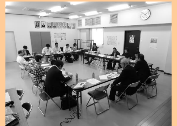
▲当日の意見交換の様子