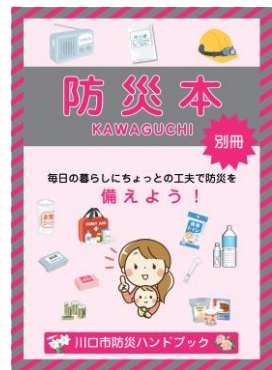
▲川口市防災ハンドブック(別冊)