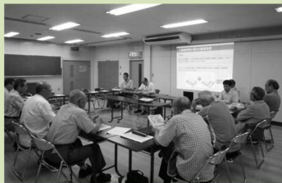
▲当日の意見交換の様子