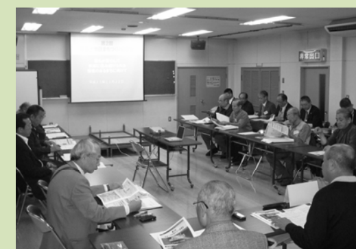
▲当日の意見交換の様子