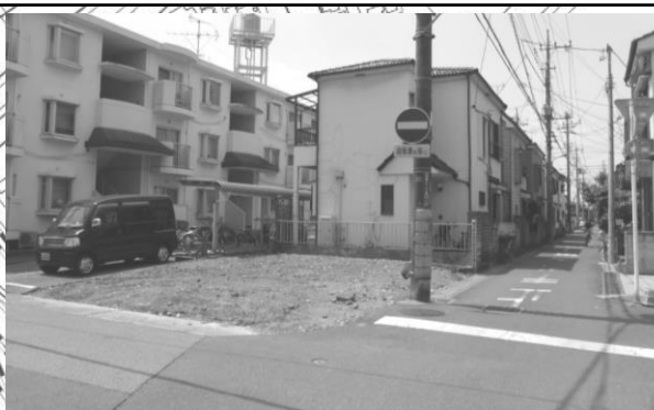
▲主要区画道路3号の用地買収にご協力頂きました！