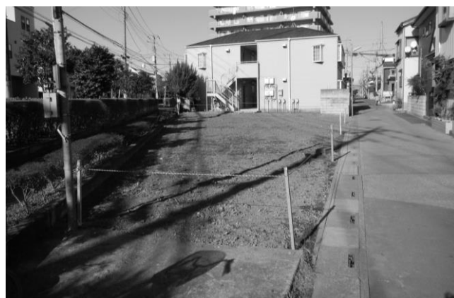
▲主要区画道路2号の用地買収にご協力頂きました！