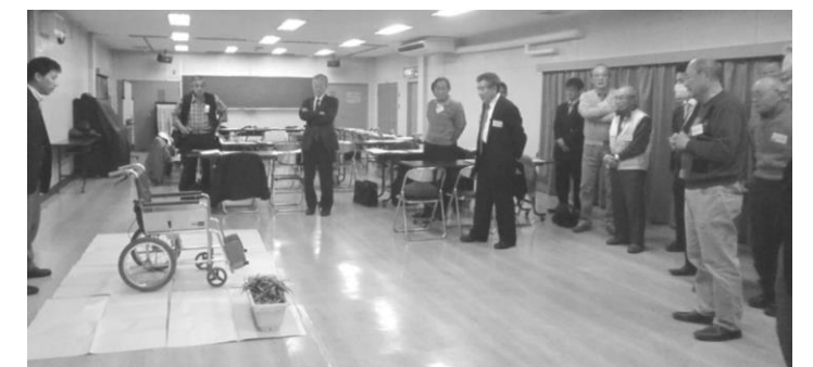
▲道路幅員について、実際の幅をイメージしながら検討しました(第 25 回協議会)。