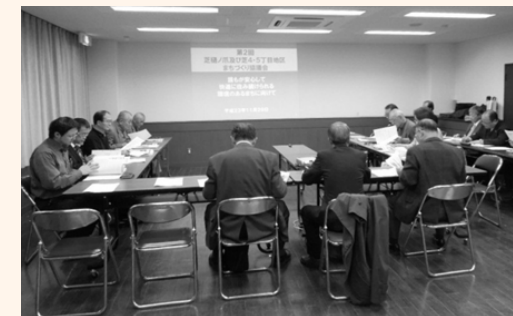
▲当日の意見交換の様子