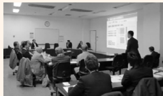
▲当日の意見交換の様子