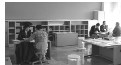
▲当日の相談会の様子

当日都合が悪くご参加できなかった方も、今後も継続して開催いたしますので、お気軽にご参加ください。