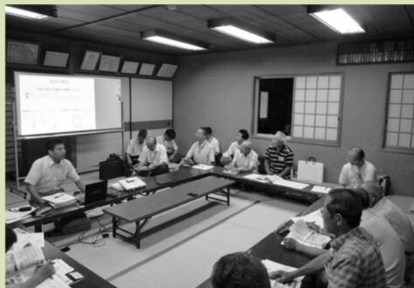
▲当日の意見交換の様子