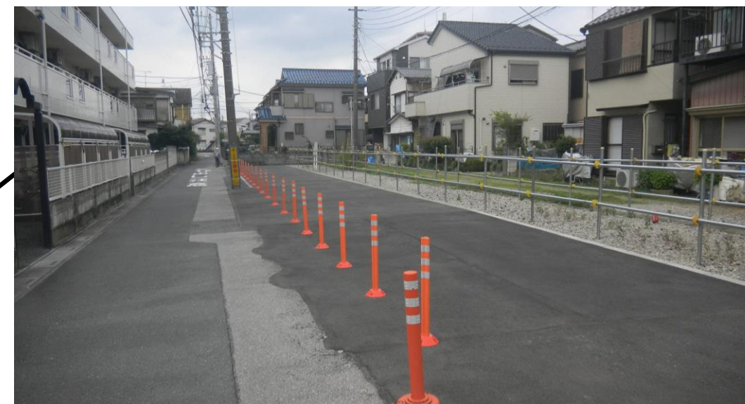
▲主要区画道路4号の用地買収にご協力頂きました。