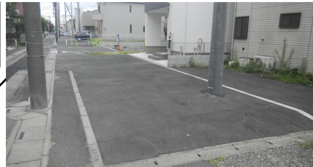
▲主要区画道路3号の用地買収にご協力頂きました。