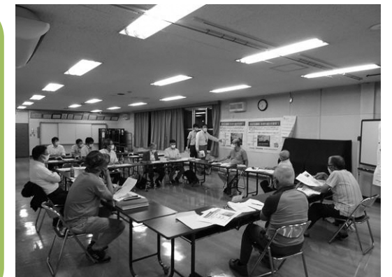
▲当日の意見交換の様子