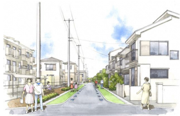
▲主要区画道路3号の整備イメージ

主要区画道路3号の整備イメージを伝えるための看板製作等に関する意見交換を行い、3号沿いに看板を設置しました！