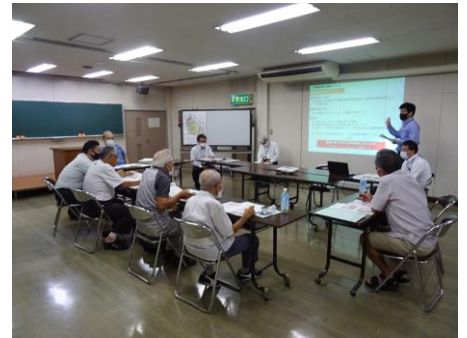
▲当日の意見交換の様子