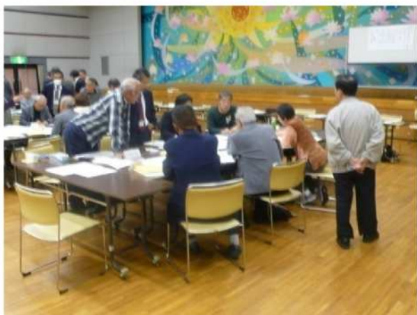
フリートーク中（班別）