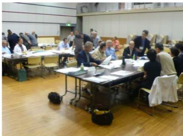
フリートーク中（班別）