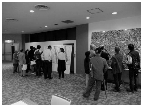
会場受付前の掲示風景（航空写真と協議会での検討図面を掲示しました）