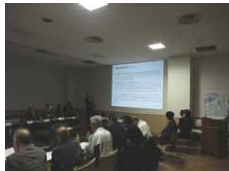
会場風景(説明風景)

仮議長の選出について 課題 1.協議会の名称と会則について 議題 2.会長の選出について 議題 3.副会長、運営委員の選出について 検討の進め方と今後のスケジュールについて