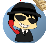
ニセ弁護士 (詐欺犯人)