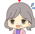
被害者 (知らないうちに加担)

① 警察官等を名乗って電話 「息子さんが逮捕された」 「今、示談書類を作っている」