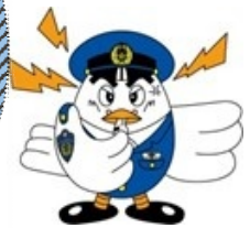
埼玉県警マスコット 「ポッポくん」