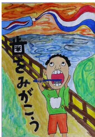
戸塚南小5年 高橋 希