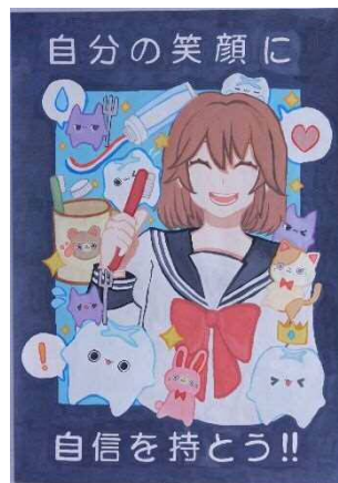
里中2年 澁谷 香織