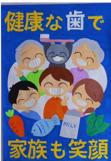
領家中3年 藤澤 彩純