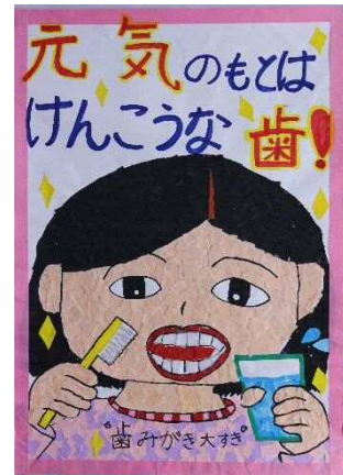
幸町小4年 井上 彩