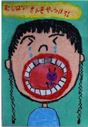
芝樋ノ爪小1年 朝比奈 詩織