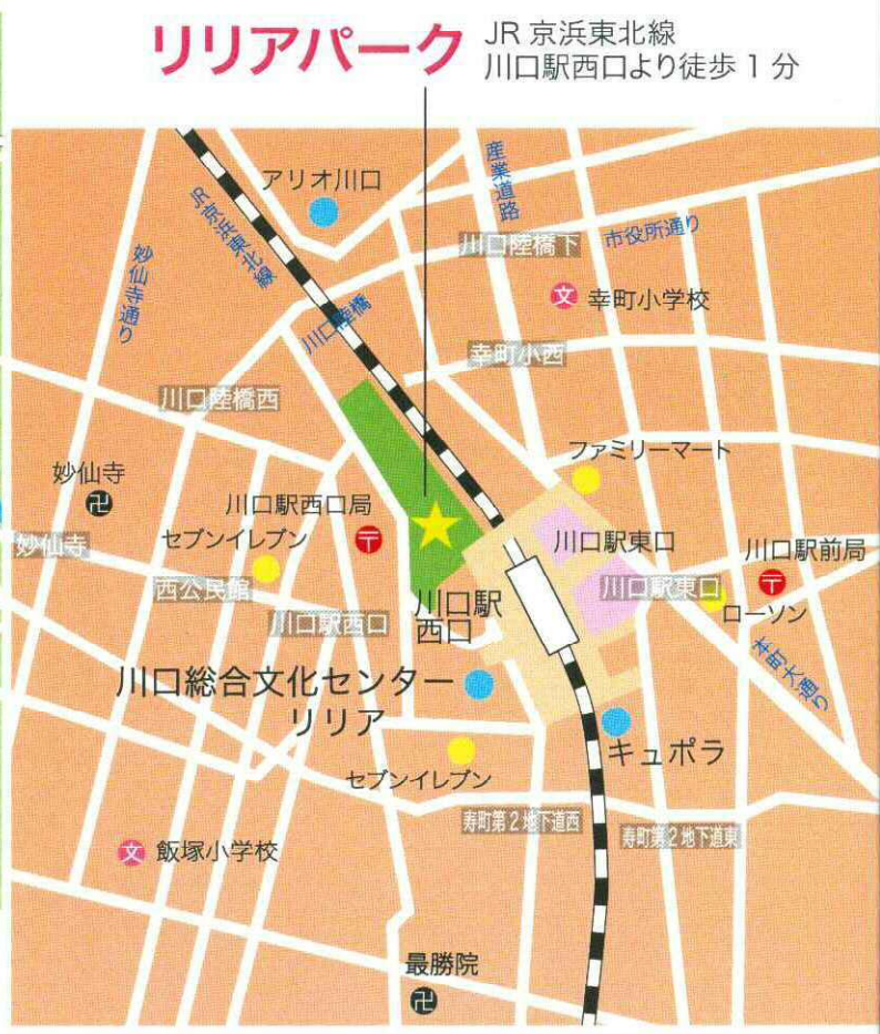
リリアパーク JR 京浜東北線 川口駅西口より徒歩 1 分

お問い合わせ 川口ツデーマーチ実行委員会事務局 〒332-8601 埼玉県川口市青木 2-1-1 川口市教育委員会 教育総務部 スポーツ課内 TEL048-259-7658 FAX048-258-3400 月曜～金曜 8時30分～17時15分 (土・日・祝日は休み) ホームページアドレス https://www.city.kawaguchi.lg.jp