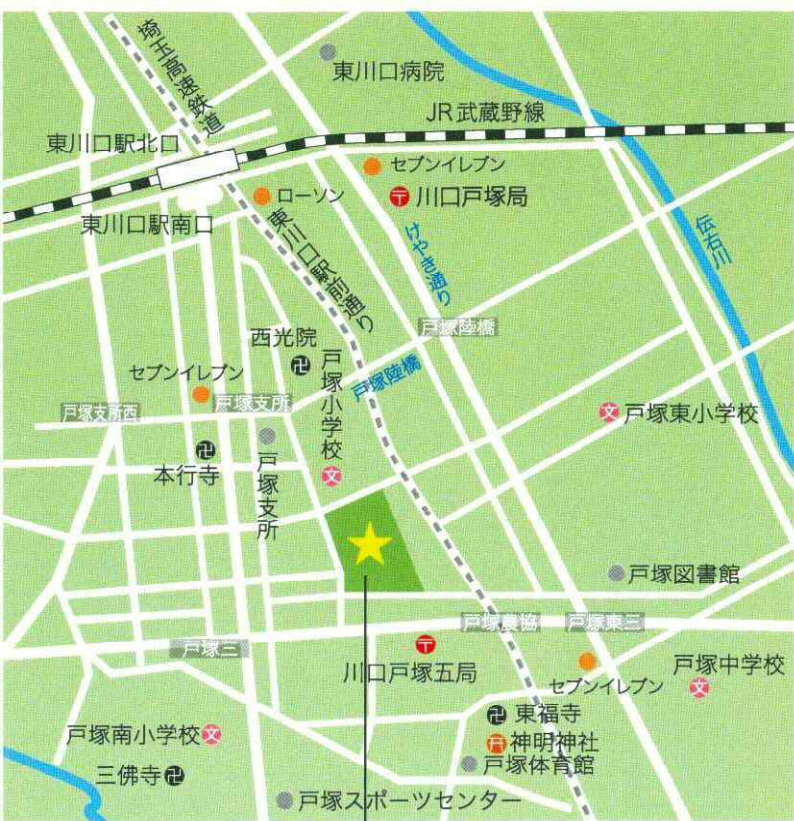
(とづかなかだいこうえん) 戸塚中台公園 JR 武蔵野線・埼玉高速鉄道 東川口駅南口より徒歩 15 分