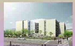
平成30年度開校 新市立高校イメージ図