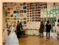
アートギャラリー