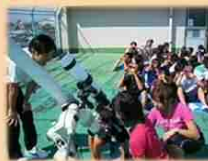
科学館(太陽観測出張授業)