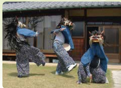
市指定無形民俗文化財 江戸袋の獅子舞