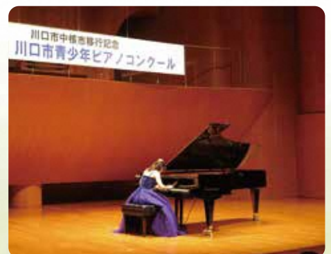
川口市青少年ピアノコンクール