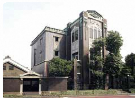
国指定重要文化財 旧田中家住宅