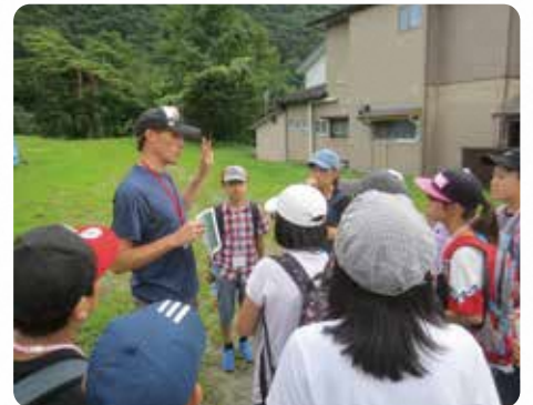
| イングリッシュサマーキャンプ