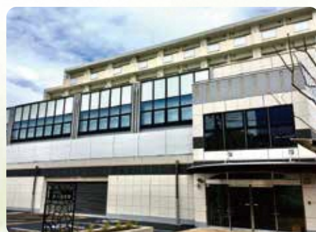
川口市立前川図書館