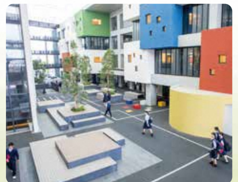
| 川口市立高等学校